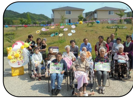
▲4月生まれの皆さん