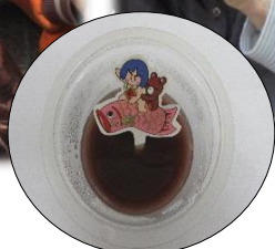
▲こいのぼりの旗を乗せた手作り羊羹は大好評