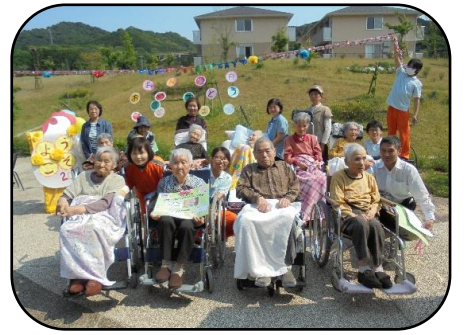
▲5月生まれの皆さん